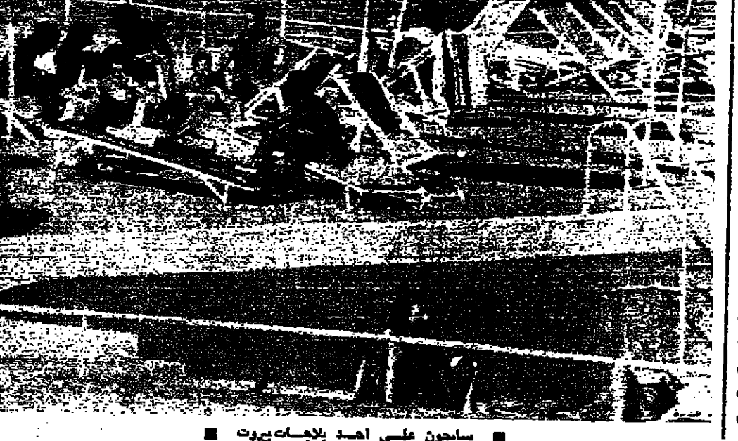
سايحون على اعيد بالاصحاب بيروت